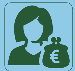
Zelf je zorg organiseren met een pgb