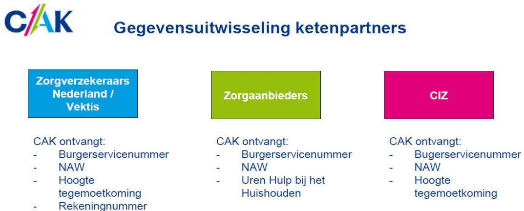
Figuur 1: Welke gegevens ontvangt het CAK?

Of u recht heeft op de algemene tegemoetkoming Wtgc wordt bepaald op basis van gegevens van het Centrum indicatiestelling zorg (CIZ), zorgverzekeraars en de eigen bijdrage Wmo van het CAK. Het CAK ontvangt het burgerservicenummer (BSN) en naam, adres en rekeningnummer van de mensen die recht hebben op de tegemoetkoming (zie figuur 1). Het CAK ontvangt uw medische gegevens dus niet. Op basis van de aangeleverde gegevens berekent het CAK hoe hoog de algemene tegemoetkoming Wtgc per persoon is.