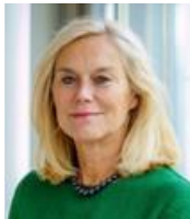
1 Sigrid Kaag