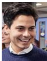
2 Rob Jetten