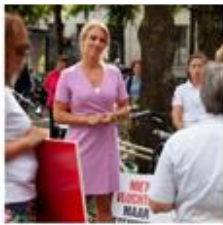
1. LILIAN MARIJNISSEN