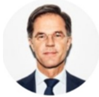
1. Mark Rutte