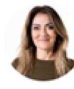
5. Dilan Yesilgöz-Zegerius